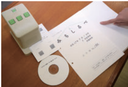
▲左から音声コード版、声の議会報、点字版

本市議会では、視覚障がいを持つ方に市議会への関心と理解を深めてもらうため、市議会報のダイジェスト版として、「点字版」、「声の議会報」(CD)、「音声コード版」を作成・配布しています。作成には、山形点訳赤十字奉仕団と市内高校の放送部にご協力をいただいております。