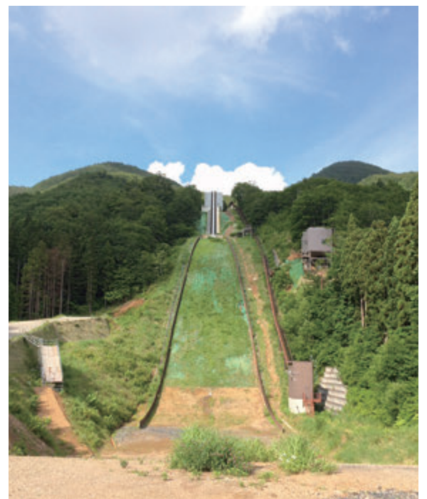
▲サマーヒル化による蔵王の観光振興に期待

スポーツ保健課長 26年度の実績では、指定管理料の内訳として、委託料が約380万円、光熱水費が約300万円、その他の経費を含め総額が約780万円である。サマーヒル化により新たに想定される業務は、雪止めネットの取り外しなどで約300万円、散水による水道料金が約150万円、職員を常駐させた場合の人件費として約120万円、合わせて570万円程度を見込んでおり、総額で1350万円程度の経費が掛かるものと試算しているが、詳細な業