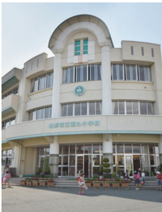
▲5年間で児童が100人以上も増加している第九小学校

こども福祉課長 国の基準額が毎年増額されているため、今後、市の基準額を上回るような場合には、国の基準額を適用することが考えられる。