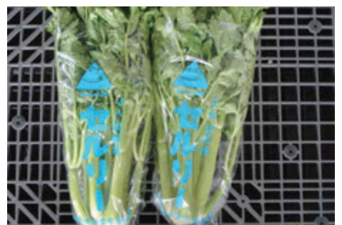
▲山形セルリーの高品質・高ブランド化を目指す

委員 セルリーの産地として高品質化・高ブランド化を目指すとのことだが、全国的に見た本市の生産状況はどうか。