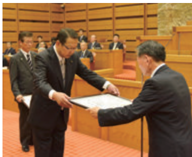
▲表彰状の伝達を受ける議員