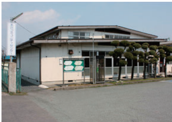
▲建て替え後の有効利用が望まれる

委員 個人番号カードの有効期限は発行から10年間とのことだが、期限満了での再交付の手数料はどのようになるのか。