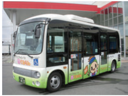
▲地域に根ざしたコミュニティバスの運行