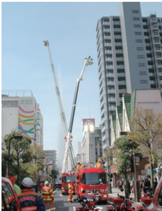
▲今回の購入で3台目の配置となるはしご車

委員 さまざまな大きさのしご車がある中、今回の車種を選定した理由は何か。 警防課長 30m級先端屈折はしご車は、10階程度の建物に対応し、市内の中高層建築物の約94%をカバーすることができる。11階以上の建物は、消防法の規制が厳しく、安全性が強化される高層建築物となっているため、このたびは規制が少ない10階程度の建物に対応するものである。