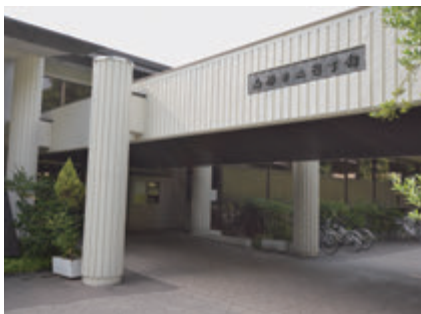
▲より利用しやすい市立図書館に