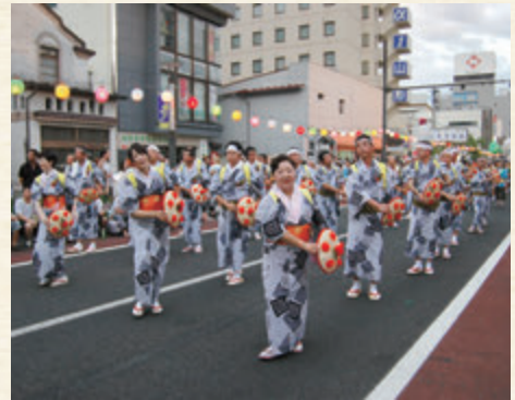
▲▼昨年の花笠まつりの様子