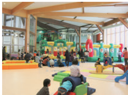
▲子どもたちのすこやかな育ちのために

Q 市立図書館に、画像の閲覧や複写ができる図書館向けデジタル化資料送信サービスを導入してはどうか。 A 国立国会図書館の図書館向けデジタル化資料送信サービスは有意義なシステムであるため、導入に向けて検討を進めていく。 Q 市立図書館は最寄りのバス停から離れているため、バス路線を整備すべきではないか。 A 図書館周辺は市街地の中でも交通サービス水準の低い地域であるため、路線バス運