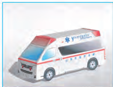
ペーパークラフト 完成イメージ