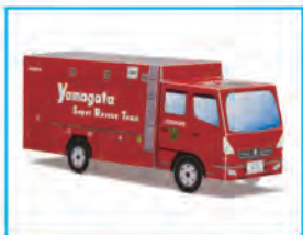
ペーパークラフト 完成イメージ