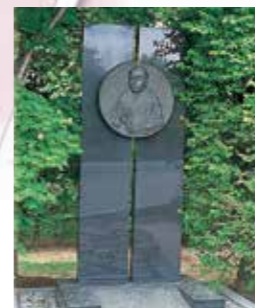
5 斯波兼頼レリーフ 兼頼の菩提寺光明寺所蔵の画像を基に制作。(昭和52年建立)