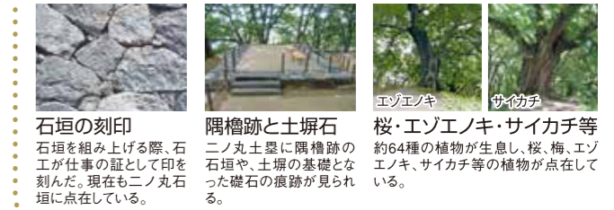
石垣の刻印 石垣を組み上げる際、石工が仕事の証として印を刻んだ。現在も二ノ丸石垣に点在している。