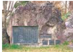
19 結城よしを歌碑 山形県出身童話作家結城芳夫(1920~1944)が19才の時に作った童謡「ないしょ話」の歌碑。(昭和41年建立)