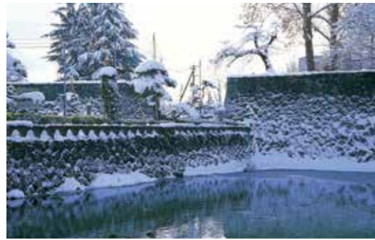
20 北門(二ノ丸北不明門跡)