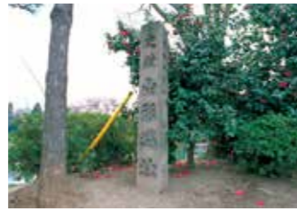
22 山形城址碑 東大手門復原前、東門に建立されていた碑。(昭和2年建立)