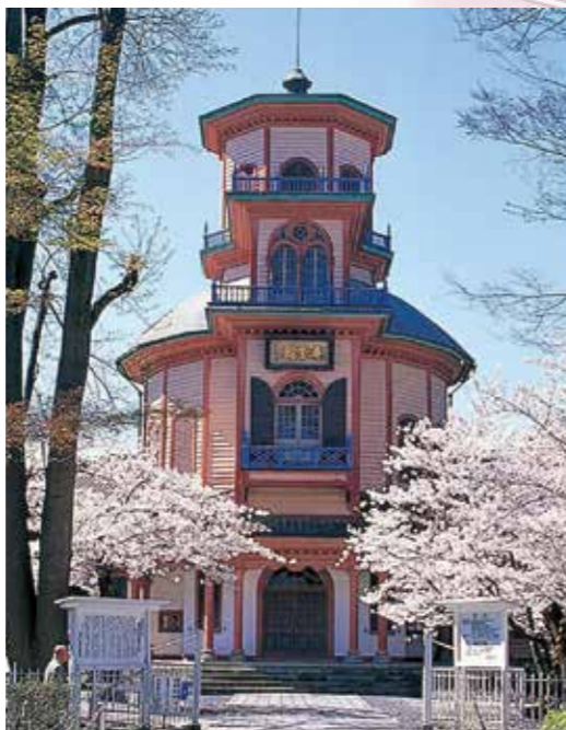
6 山形市郷土館(旧済生館本館) 明治11年(1878)に県立病院「済生館」として建築。3層楼の擬洋風建築で、昭和41年(1966)に国重要文化財に指定。昭和44年(1969)に現在地に移築、昭和46年(1971)に「山形市郷土館」として開館。