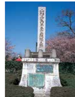
3 山形城主最上義光顕彰詞碑 義光の歴史と功績を讃えた石碑。(昭和52年建立)