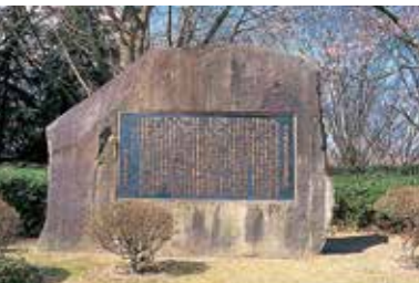
4 歩兵第三十二連隊跡碑 歩兵第三十二連隊本営(明治29年~終戦駐屯)の初代から31代までの歴代連隊長名が記載。(昭和43年建立)