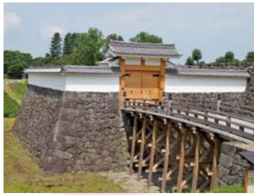
13 本丸一文字門石垣・大手橋・高麗門・枡形土塀 現存する絵図面を元に、平成15年に石垣、平成17年に大手橋、平成26年に高麗門及び枡形土塀を復原。