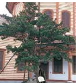
9 キャラボク(イチイ) 義光の時代に植樹されたとされ、目通り幹周2.47mは山形市内最大。