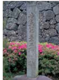
21 歩兵第三十二連隊跡碑 元山形県知事安孫子藤吉氏が昭和39年(1964)に建立。