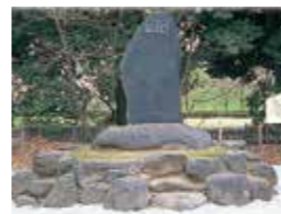
7 木村逸堂寿蔵碑 明治7年(1874)、山形県公立病院の創立にあたり、同医局の教師、医員を任せられた人物。(明治18年建立)