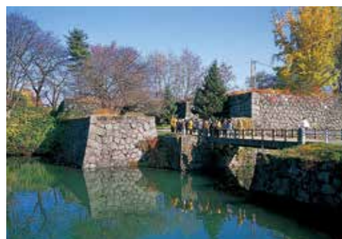
15 西門(二ノ丸西不明門跡)