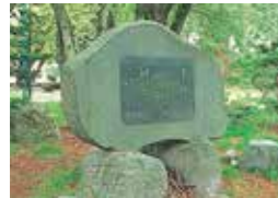
18 金澤忠雄謹書碑 高橋月甫の言葉「幸福は今日も朝から櫻かけ」を元山形市長金澤忠雄氏が在任中に建立。