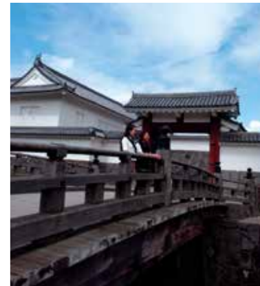
1 二ノ丸東大手門 櫓門・多門櫓・高麗門・土塀を備えた山形城二ノ丸の正門を、史実に従い日本古来の建築様式により木造建で平成3年(1991)に復原。