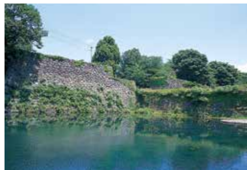
14 南門(二ノ丸南大手門跡)