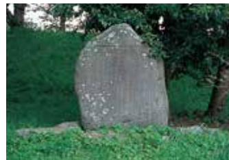
17 日露戦桜碑 明治37年(1904)日露戦争に出兵、同39年(1906)に霞城への凱旋を記念し、戦死者鎮魂の桜を植樹と記載。(大正12年32連隊建立)