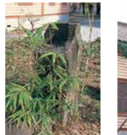
10 首洗い石鉢 天正12年(1584)、義光が谷地城主白鳥十郎長久を斬殺し、首をのせたとされる石鉢。