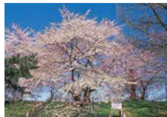
16 霞城の桜 兼頼が山形城築城の際に植えたといわれるエドヒガンの古木。(樹高12.5m、根周7.8m・市指定天然記念物)