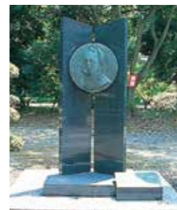
8 ローリュウ像 明治初期に診療、西洋医学の発展に寄与した山形県済生館医学寮教頭を勤めたオーストリア人医師。(昭和45年建立)