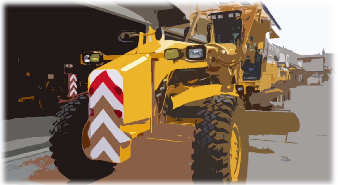
令和2年度配備 コマツ GD-675-6 3.7m級グレーダー