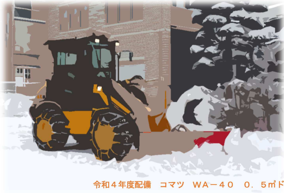
令和4年度配備 コマツ WA-40 0.5mドーザー