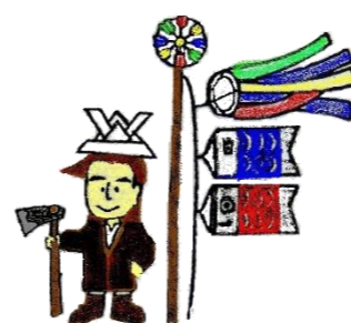
西部公民館マスコット「大地くん」