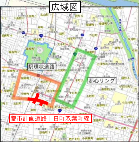
都市計画道路十日町双葉町線