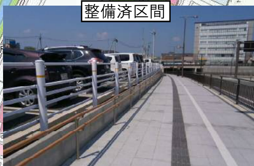
消雪化された歩道が整備され、 児童の通学の安全性が向上した。