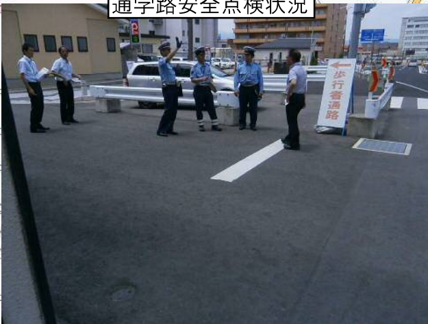
通学路安全点検状況