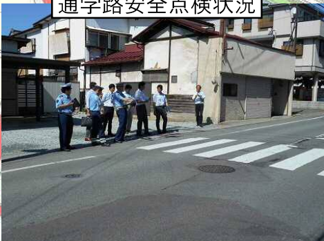
通学路安全点検状況

＝点検の内容＝ 沿線に住む児童が、安全に通学路へ歩行できるよう、早期の歩道整備が必要。