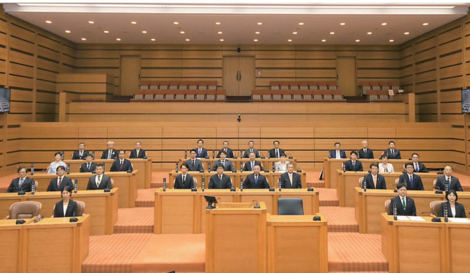
▲新たに選ばれた市議会議員の顔ぶれ