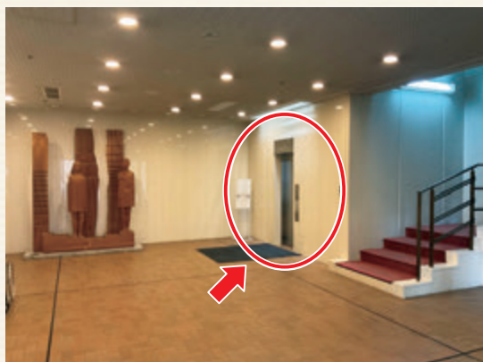
▲入口から見て右手にあるエレベーターをご利用ください。