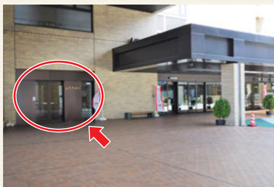
▲市役所正面入口の左側が市議会入口です。