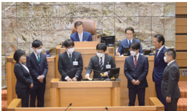
▲開票の様子を見守る開票立合人の議員

また、山形市監査委員の選任について、令和5年度山形市一般会計補正予算、専決処分承認についての各議案が上程され、詳細な審査の後、本会議で総務・厚生・予算委員長の報告を受けて採決した結果、全員異議なく同意、可決、承認しました。