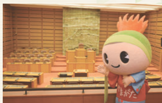
▲本会議場の傍聴席は61席、車椅子席は2席あります。